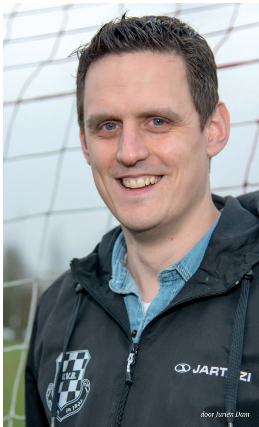
door Juriën Dam

Mullaert storte zich twaalf jaar geleden in het vrijwilligerswerk. Hij gaf daarmee gehoor aan de oproep van het bestuur om een jeugdcommissie te introduceren.